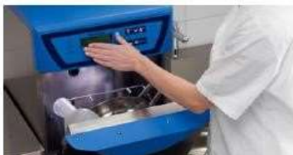
Automata ajtó funkció (opció)

A kérelmező által benyújtott gyártói termékprospektusban az alábbi információk találhatóak: