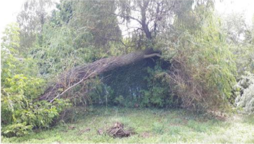
Növényzet által sűrűn benőtt, lomos tekepálya: